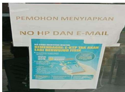
Gambar 3 Permohonan Menyiapkan No HP dan E-Mail

Indikator cakupan layanan harus diperhatikan jika ada kebijakan yang memberikan persyaratan untuk penyediaan layanan pada tingkat layanan minimum tertentu.