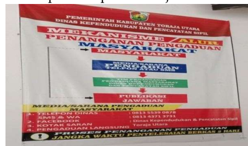
Gambar 2 Alur Penanganan Pengaduan