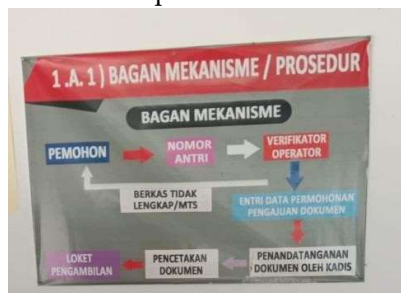
Gambar 1 Bagan Mekanisme

Yang paling menantang untuk diukur adalah yang terkait dengan kualitas dan standar layanan karena melibatkan penilaian subjektif. Saat menggunakan indikator kualitas dan standar layanan, berhati-hatilah karena jika terlalu mendesak, mereka dapat mendorong perilaku yang kontraproduktif. perubahan jumlah pengaduan masyarakat terhadap pelayanan tertentu. Berikut contoh SOP Kantor kependudukan dan Pencatatan Sipil Kabupaten Toraja Utara