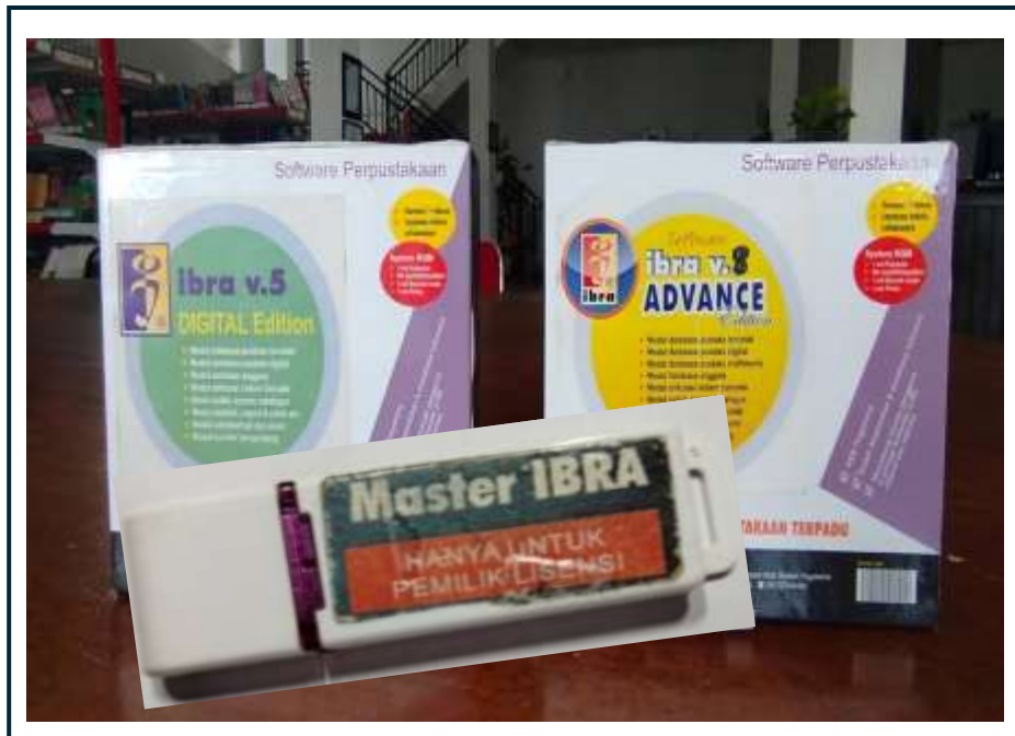
foto kotak CD dan FD, data dukung dokumen lisensi penggunaan aplikasi IBRA v.5 dan IBRA v.8