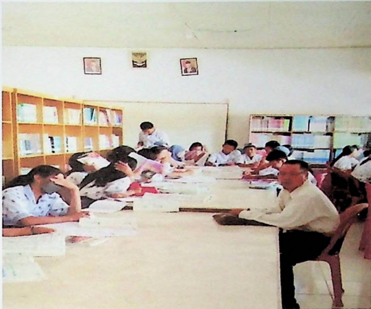
Dokumentasi Bersama Siswa Saat Telaah Kemungkinan- Kemungkinan Pemecahan permasalahan