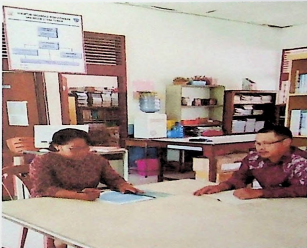
Dokumentasi Saat Identifikasi Permasalahan