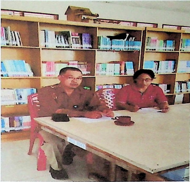
Dokumentasi Permintaan Pertanyaan Konsultasi