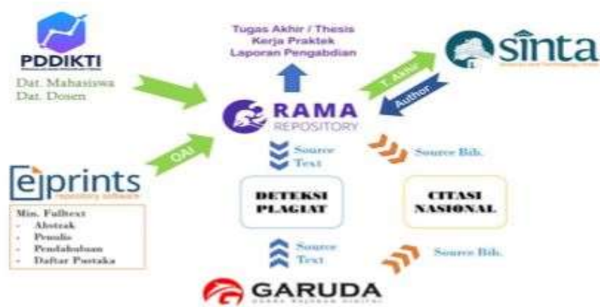
Gambar 1.2 Skema sistem RAMA Repository