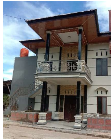
Gedung Gereja dan Rumah Gembala