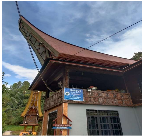
Kantor KSP. Rantedada