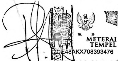
Rut Masena Nirm. 20010182