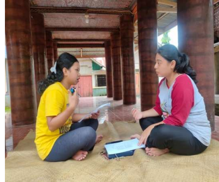
Gambar 2. Wawancara informan II