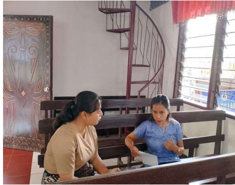
Gambar 1. Wawancara Informan I